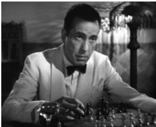
Bogart, Rick en Casablanca, ejerce la que se puede denominar variante Casablanca contra la defensa francesa al inicio del film

Chandler, gran aficionado- relacionándolo con el mítico campeón cubano Capablanca (a quien, por cierto, su compatriota poeta Nicolás Guillen dedicara un poema. Aunque si se trata de poesía y ajedrez escojo ‘Los jugadores de ajedrez’ de Fernando Pessoa, más allá de los muy conocidos versos de Jorge Luis Borges).