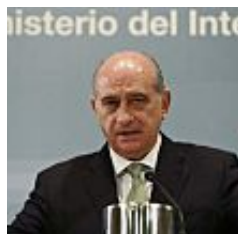
El ministro de Interior de España no tiene vergüenza