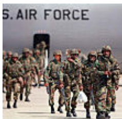
Panamax 2015 confunde soberanía con poderío militar